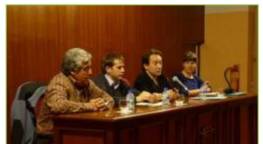
Mesa de ponentes 1 de Marzo.

Al finalizar se abrió un amplio turno de preguntas y se aplaudió la exposición.