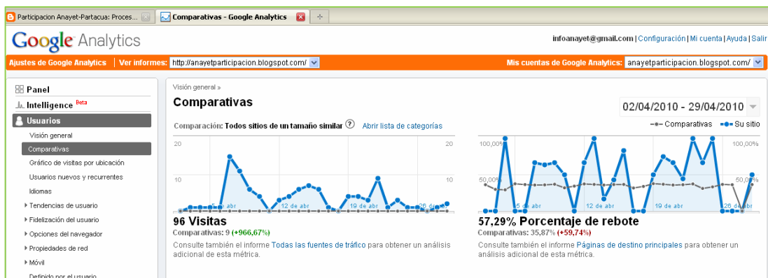
Extracto de las estadísticas de visitas en el blog

Si además, a esta valoración añadimos la intención que los participantes tienen de seguir adelante con el uso de la plataforma creada para continuar la labor informativa, entonces, sí que podemos hablar de valoración positiva.