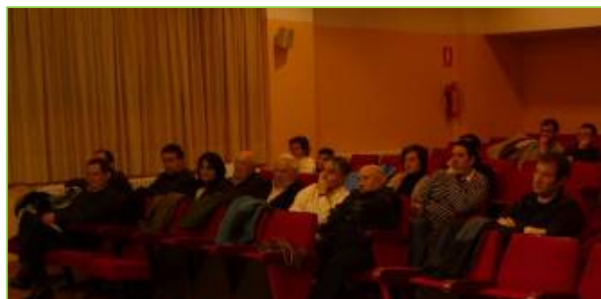
Nutrido grupo de representantes de la propiedad privada.