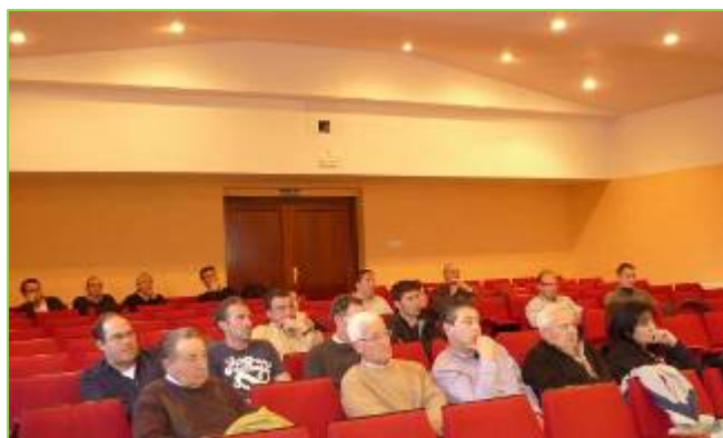
Público en la Casa de la Cultura de Sabiñánigo