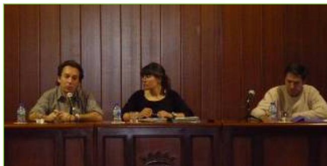
Mesa de ponentes durante el desarrollo de la sesión.

Durante el turno de preguntas se habló sobre las posibles restricciones, sobre qué especies amenazadas podría haber en un entorno como el del PORN Anayet-Partacua y sobre los planes técnicos de caza.